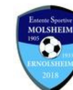
MOLSHEIM ERNOLSHEIM E.S.