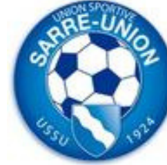
SARRE UNION U.S.