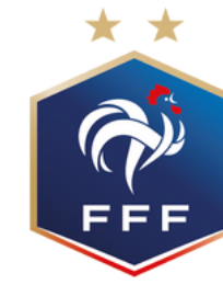
DRULINGEN ESPOIR 22