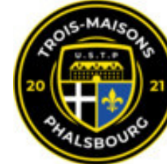
TROIS MAISONS/PHALSBOURG U.S.